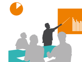
Impulsvortrag und Fragestellung